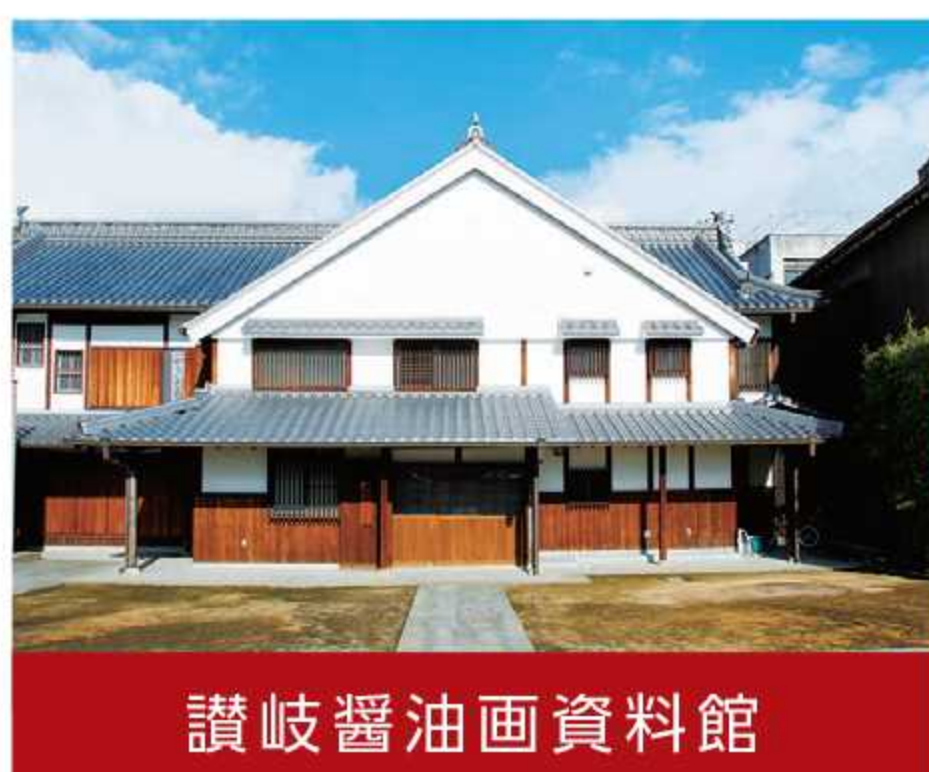
讃岐醤油画資料館